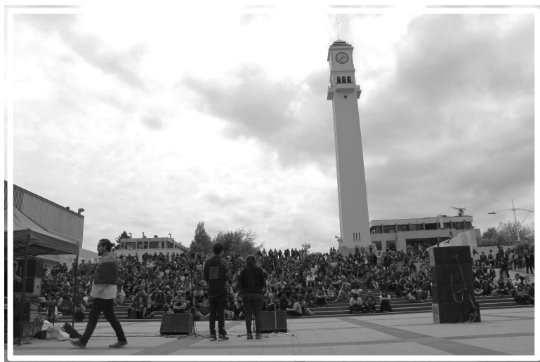
Figura 1: encuentro en el Foro de la Universidad de Concepción.

Las semanas siguientes a este encuentro, se realizaron reuniones semanales ampliadas de la Asamblea Provincial, que trataban temas coyunturales y promovían hitos mediáticos hacia la movilización dentro de los territorios. Actualmente, la Asamblea considera una amplia y heterogénea participación de diferentes comunas y actores, que apuestan hacia la movilización social constante. El funcionamiento de la Asamblea ha contemplado el trabajo por Comisiones, a saber: de Articulación, cuyas funciones son la comunicación y vinculación interna y externa, así como guiar metodológicamente las reuniones ampliadas; de Formación, dedicada a realizar y promover la educación popular; de Seguridad, cuyos objetivos son apoyar en temas jurídicos, de salud y de seguridad en la movilización, sumado a la comunicación entre las diferentes asambleas en casos coyunturales; y, finalmente, de Comunicaciones, que elabora material de difusión, tanto virtual como físico, que sirve de agitación en los diferentes territorios.