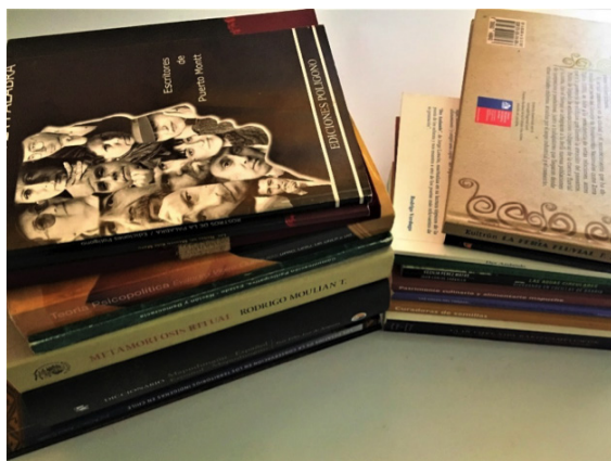
Libros de las editoriales del sur de Chile

temáticas orientadas a lectores y públicos específicos. En el universo de las editoriales independientes del sur, Kultrun es el sello que cuenta con el catálogo más extenso y amplio (221 títulos), lo cual, da cuenta de más de 30 años de trabajo dedicados al oficio del libro.