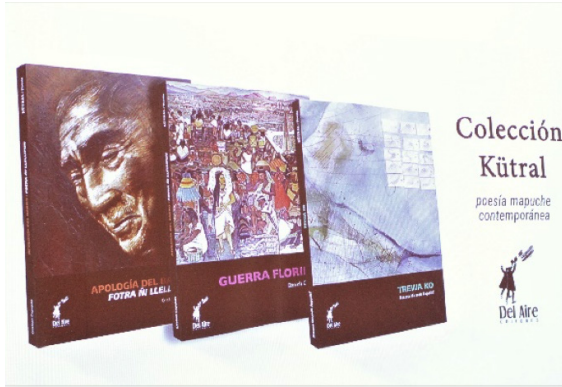
Colección Kütral del catálogo de Del Aire Editores

Luego aparecen los proyectos Del Aire y Arte Sonoro Austral con 20 o más títulos publicados, aunque se debe señalar que son proyectos editoriales más jóvenes y recientes que Kultrun, Fértil Provincia y Cagtén.