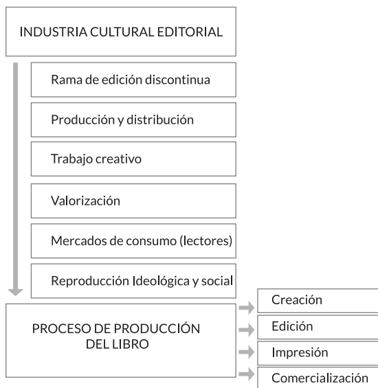
Figura 2. El proceso de producción del libro